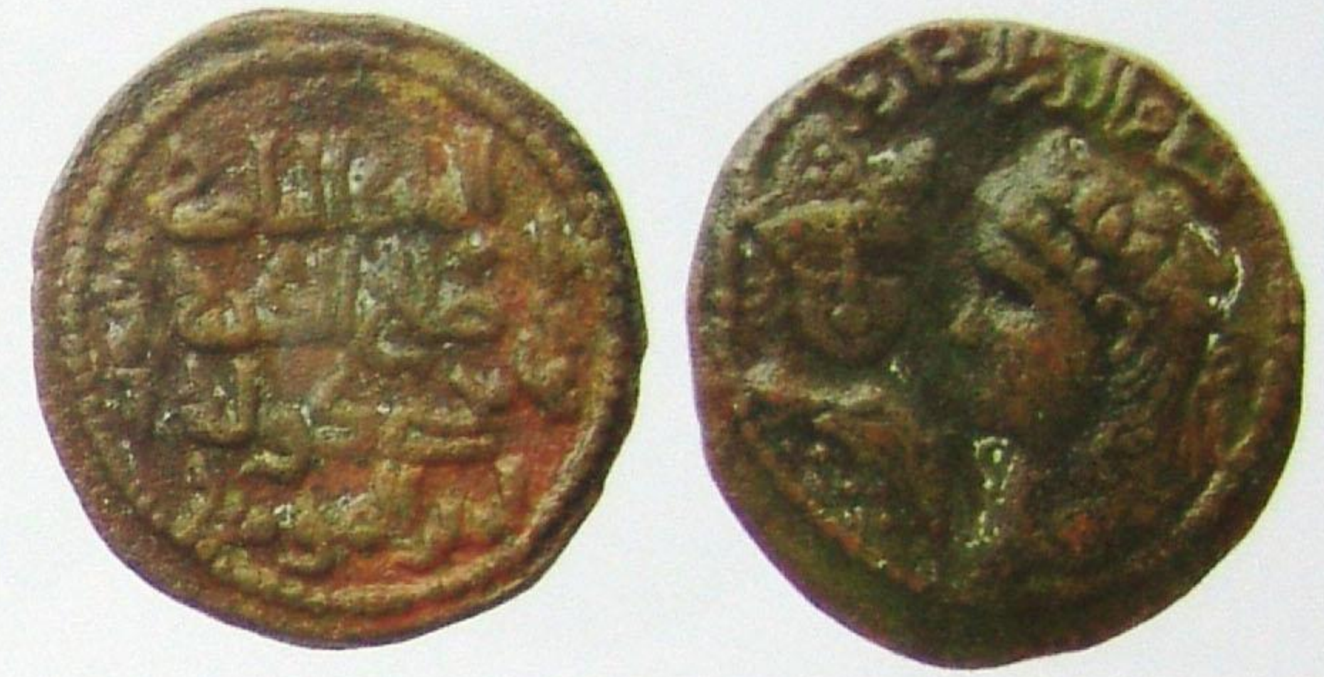
درهم نحاسي الحاكم: يوسف بن أيوب

In the minting of their coins, the Bani Hafs followed the style of the Al-Muwahidin state; for this reason, it is difficult to differentiate between the coins of the two states. Coins of North Africa were also minted by the Bani Hammood, Bani Abbad Nasr and Bani Murrein states.